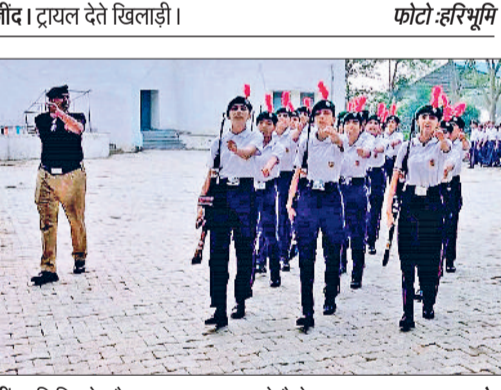
जीट। शिविर के दौरान कदम ताल करते कैटेडर।