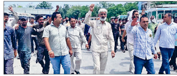
कैथल। प्रदर्शन करते रोडवेज कर्मचारी।