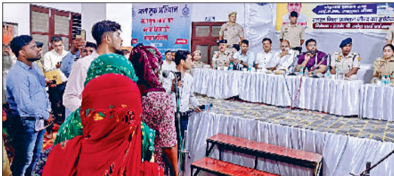
जीद। रात्रि ठहराव के दौरान शिकायतें सुनते हुए डीसी।