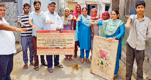
अलेवा। दालभवाला गांव में बेटी बचाओ, बेटी पढ़ाओ पर आधारित कार्यक्रम में भाग लेते स्वास्थ्य कर्मचारी तथा ग्रामीण।

नियमित रूप से योग कर व्यक्ति न सिर्फ स्वस्थ और निरोग रहता है बल्कि कई बीमारियों पर विजय भी प्राप्त कर लेता है। आज जब दुनिया भर में लोग स्वास्थ्य और कल्याण के लिए चिंतित हैं। योग एक प्राचीन अभ्यास के रूप में उभर कर सामने आया है जो शारीरिक, मानसिक और आध्यात्मिक स्वास्थ्य को बढ़ावा देता है। योग जो भारत की प्राचीन परंपरा का हिस्सा है न केवल शारीरिक रूप से मजबूत बनाता है बल्कि मन को शांत और एकाग्र करने में भी मदद करता है। योग के लाभों के बारे में जानने से पहले, यह समझना जरूरी है कि योग वास्तव में क्या है। योग कोई धर्म नहीं है, यह जीने का एक तरीका है। जिसका उद्देश्य स्वस्थ शरीर में स्वस्थ मन की प्राप्ति है।