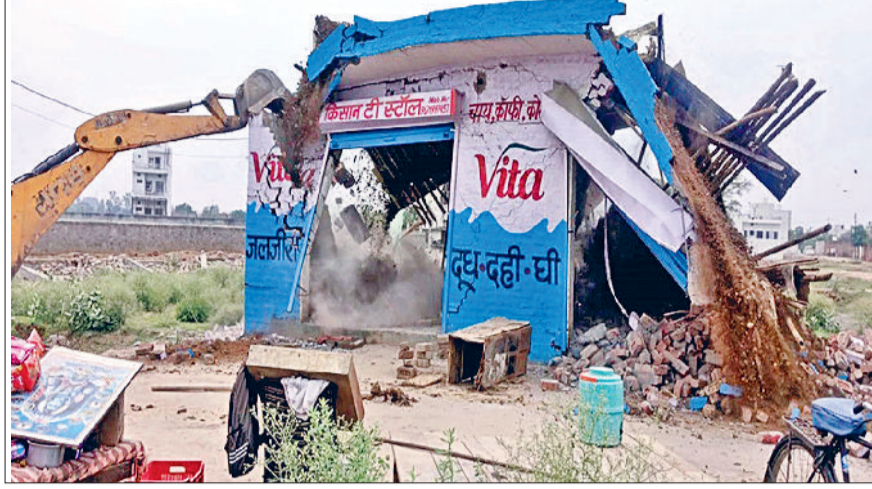
जीट। अवैध निर्माणों को दहाते हुए।