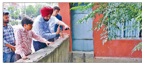
कैथल। डीसी जनस्वास्थ्य विभाग के नालों व ड्रेनों का निरीक्षण करते हुए।

डीसी ने किया नालों व ड्रेनों का निरीक्षण, ग्योंग ड्रेन की सफाई में तेजी लाने के लिए निर्देश।