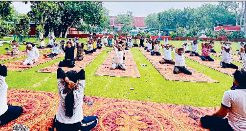
जीट। योग शिविर में भाग लेते हुए साधक।