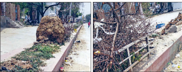
जीद। सड़क किनारे डिवाइडर पर पाथा गया गोबर।

डिवाइडर तथा सड़क के साथ बस्तियों में पाथा जा रहा गोबर। गोबर की बंदूब के कारण लोगों का आवागमन हुआ मुश्किल।